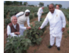
Agricultura iogue: processos orgânicos e meditação