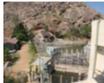
Estação de tratamento de águas servidas

Materiais para a realização de workshops de fortalecimento da consciência de cooperação com o mundo, em harmonia com a natureza, são oferecidos pela BK, para uso livre não comercial.