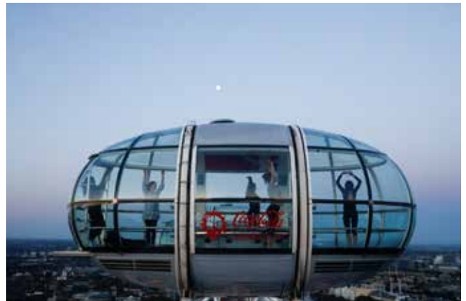
Praticantes de yoga em aula no nascer do sol durante o Solstício de Verão, do alto da London Eye, em Londres

A Brahma Kumaris desenvolveu práticas de Raja Yoga em inúmeras cidades brasileiras como uma das datas que compõe o calendário de comemoração dos seus 40 anos no Brasil. Além destas atividades locais, a BK ofereceu uma meditação on line aberta que foi acompanhada por um grande número de pessoas.