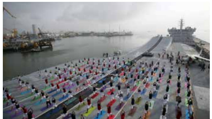
Integrantes da Marinha indiana praticam yoga no deck da NS Viraat, um porta-aviões desativado da Marinha Indiana