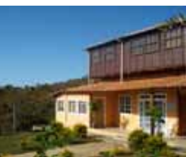
Portal da Paz Serra do Cipó - MG