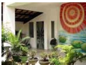
Vilas do Atlântico Lauro de Freitas - BA

Que tal um fim de semana destinado ao refrescamento e preenchimento interior? Você pode participar de retiros espirituais na Brahma Kumaris. Há quatro sedes no Brasil especialmente destinadas à realização de retiros espirituais. Em meio a montanhas ou próximo à praia, as sedes de retiro da Brahma Kumaris estão localizadas em locais privilegiados, e oferecem momentos de profunda tranquilidade e crescimento pessoal.