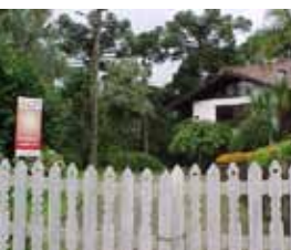
Luz da Serra Canela - RS