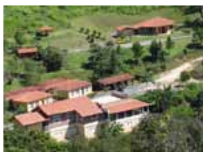
Serra Serena Serra Negra - SP

Os eventos ocorrem nos finais de semana e em alguns feriados.